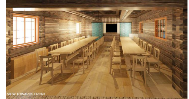
Kuva 2: Näkymä takaa eteen

Kuva 1: Luokkahuoneen ovelta sisään tullessa välittömästi oikealla puolella on osa seinää, jossa lohenpyrstörakenne on nähtävissä. Vasemmalla seinällä on kuvattu puita ulkoilmaympäristössä ja peräseinällä on sauna. Katossa on seitsemän Otavan tähteä symbooleina vuonna 1870 ilmestyneestä ensimmäisestä suomenkielellä kirjoitetusta novelistä, Aleksin Kiven Seitsemän Veljeksestä.